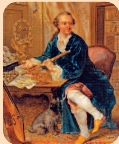
Kurfürst Carl Theodor von der Pfalz (1724 – 1799)

Mit freundlicher Unterstützung der Kreissparkasse Rhein-Pfalz